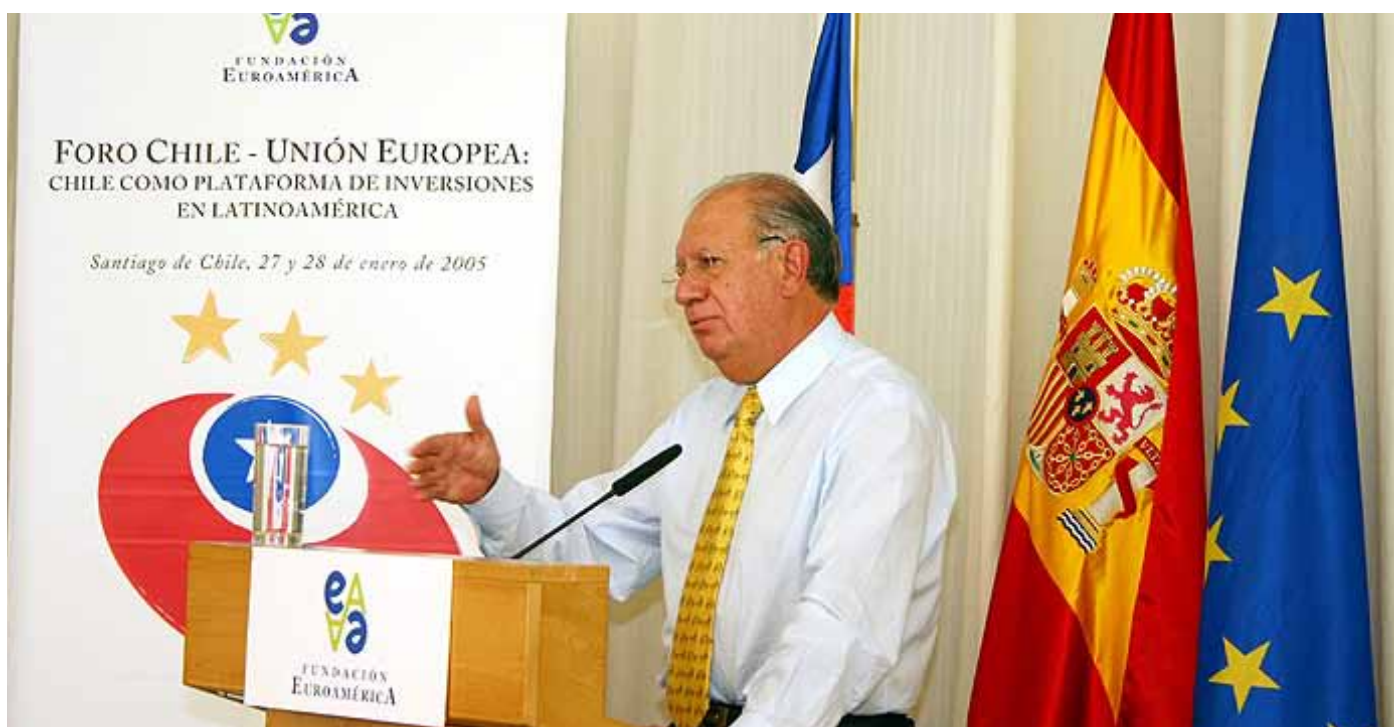
Ricardo Lagos, Presidente de Chile, durante su intervención en el II Foro Chile-Unión Europea, en el 2005

R icardo Lagos, ex Presidente de la República de Chile y actual Presidente de la Fundación Democracia y Desarrollo, ha aceptado, mediante carta dirigida a la Presidenta de la Fundación Euroamérica, Benita Ferrero-Waldner, ser miembro del Patronato. En la carta, el ex Presidente Lagos dedica, además, unas entrañables palabras a nuestra organización al recordarnos desde la época en la que ejerció como Presidente y participó en el I y II Foro Chile-Unión Europea, celebrados en 2000 y 2005. Por su parte, la Fundación Euroamérica se siente muy honrada al poder contar, entre los miembros de su Patronato, con una personalidad latinoamericana tan relevante en el panorama internacional.