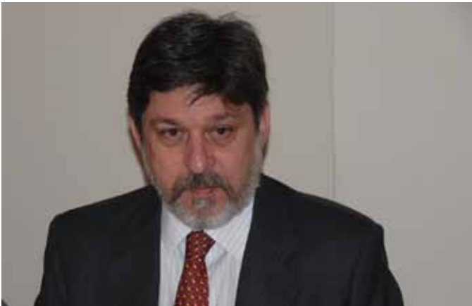
Paulo Cesar de Oliveira

Paulo Cesar de Oliveira, Embajador de Brasil en España -10 de abril de 2013-