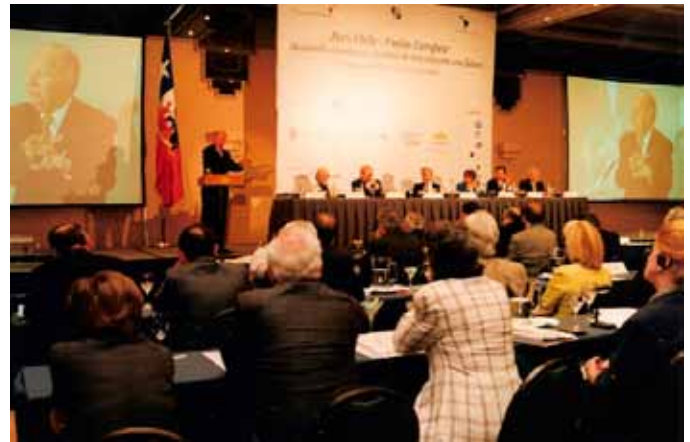
Ricardo Lagos, Presidente de Chile, durante su intervención en el I Foro Chile-Unión Europea, en el 2000

Como experto analista en temas políticos siempre ha mostrado clarividencia en sus aportaciones personales. En el artículo ‘Democracia y política ¿ambas en crisis?’ [ elquintopoder.cl ] desgrana sus reflexiones sobre las últimas encuestas en América Latina y también en Europa que recogen el gran descrédito de la política y sobre aquellas que hablan de “una crisis de la democracia en tanto ésta deja de ser valorada positivamente por los ciudadanos”. Ve tres razones que asoman como fuentes de esta