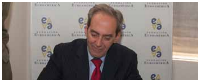
José Manuel González-Páramo