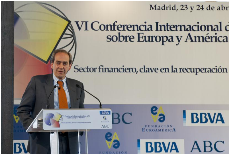
Izqda a Dcha: José Manuel González-Páramo (Consejero del Banco Central Europeo).