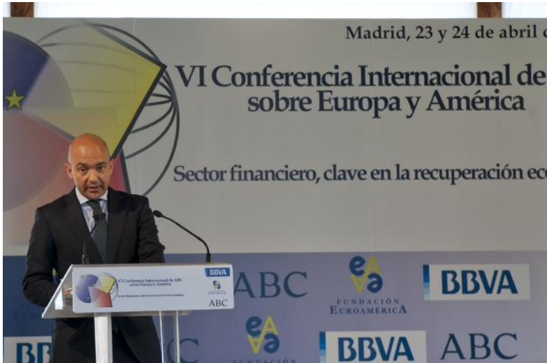
Izqda a Dcha: Jaime García-Legaz (Secretario de Estado de Comercio).