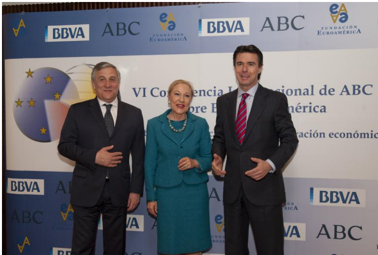
Izqda a Dcha: Antonio Tajani (Vicepresidente y Comisario de Industria, Emprendimiento de la CE), Benita Ferrero-Waldner (Presidenta de la Fundación Euroamérica) y José Manuel Soria (Ministro de Industria, Energía y Turismo).