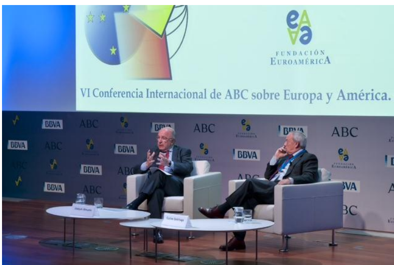
Izqda a Dcha: Carlos Solchaga (ex ministro de Economía y Hacienda), Joaquín Almunia (Vicepresidente y Comisario de la Competencia de la CE).