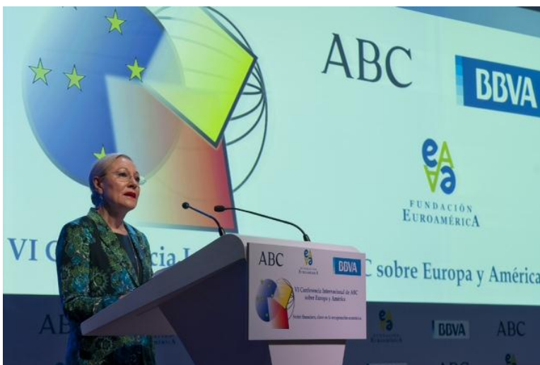
Izqda a Dcha: Benita Ferrero-Waldner (Presidenta de la Fundación Euroamérica)