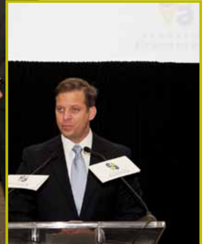
Carlos López-Cantera , Lieutenant Governor of Florida, durante su intervención en el almuerzo de clausura