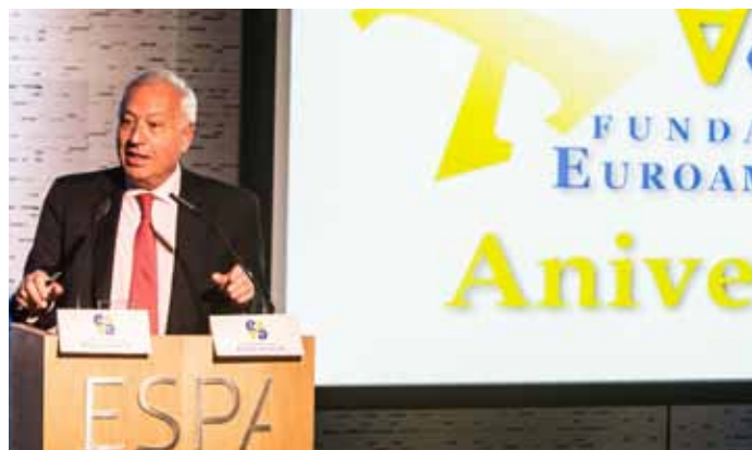
Intervención del Ministro de Asuntos Exteriores y de Cooperación, José Manuel García-Margallo