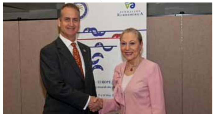
Congressman Mario Diaz-Balart y Benita Ferrero-Waldner