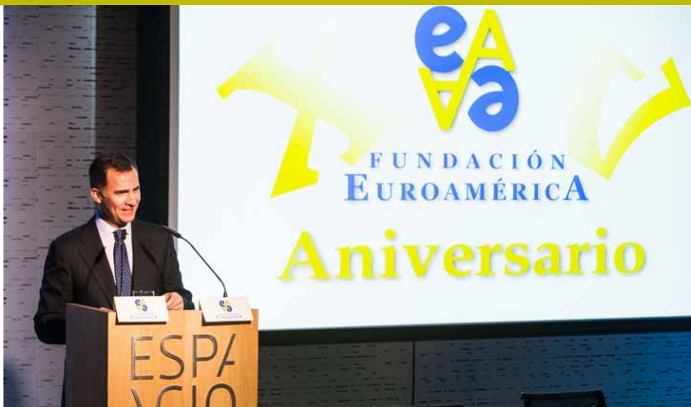
S.A.R. el Príncipe de Asturias interviene en el acto de celebración del XV Aniversario