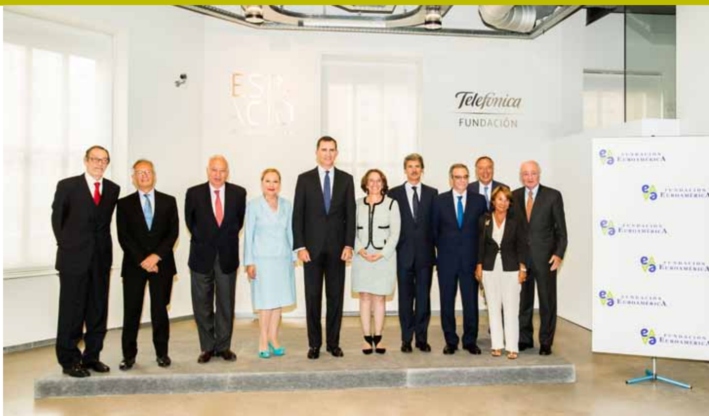
Foto de familia