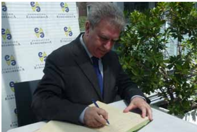
Cesar Antonio Molina firma en el libro de honor

El almuerzo-coloquio con Cesar Antonio Molina fue patrocinado por la Fundación Germán Sánchez Ruipérez. La Casa del Lector se constituye como un espacio desde donde experimentar con la lectura, sus nuevas manifestaciones, y su promoción. El director defendió la importancia de la lectura para la cultura y habló de la