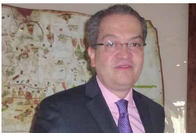
Embajador Fernando Carrillo

Fernando Carrillo Embajador de Colombia en España -20 de marzo de 2014-