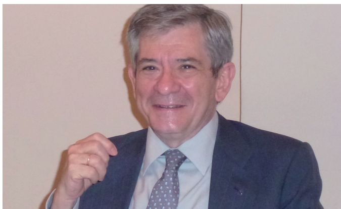
Enrique Barón durante su intervención

Ex Presidente del Parlamento europeo y ex Ministro de Transportes del Gobierno español -15 de julio-