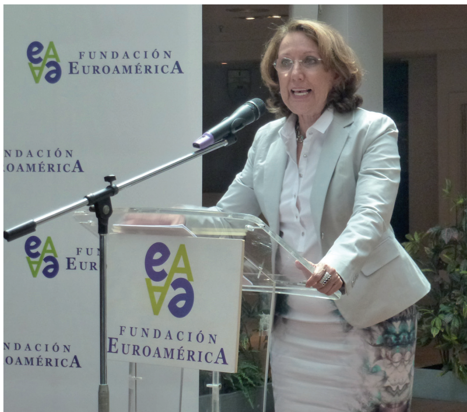
Rebeca Grynspan durante su intervención

Habló también de los grandes retos como la desigualdad creciente y los problemas globales que necesitan más implicación y esfuerzos colectivos para alcanzar soluciones definitivas. No olvidó la variedad de acuerdos de libre comercio interregionales, y reseñó el gran número de empresas españolas en América Latina, con presencia especialmente fuerte en México, Brasil, Argentina, Chile, Colombia o Perú.