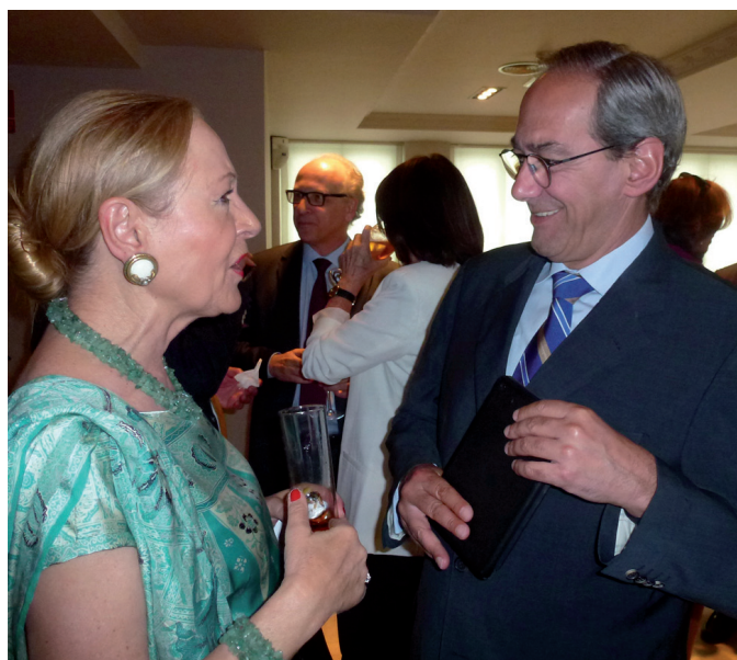
Benita Ferrero-Waldner conversa con José Manuel González-Páramo