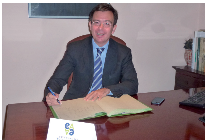
Román Escolano firma en el libro de honor

El Presidente del ICO comenzó su exposición con una breve explicación del funcionamiento del ICO: Un banco público, administrativamente adscrito al Ministerio de Economía y Competitividad, con naturaleza jurídica de Entidad de Crédito y la consideración de Agencia Financiera del Estado, con personalidad jurídica, patrimonio y