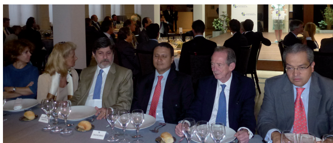
Dos planos de la mesa presidencial