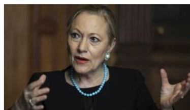
La presidenta de la Fundación Euroamérica, Benita Ferrero-Waldner.

La presidenta de la Fundación Euroamérica , Benita Ferrero-Waldner , explicó en la apertura del seminario que la actual presencia de las nuevas tecnologías de la información y la comunicación (TICs) en las sociedades está generando "cambios en los modelos y en las