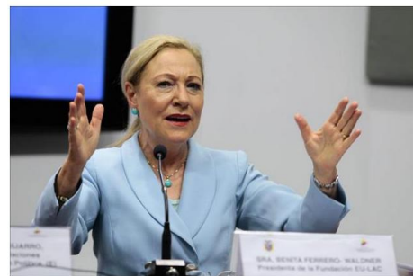
La presidenta de la Fundación Euroamérica, Benita Ferrero-Waldner.

Ferrero-Waldner destacó que las nuevas tecnologías en el sistema escolar "enriquecen y potencian la curiosidad y la experimentación" al mismo tiempo que advirtió de la necesidad de analizar los riesgos y desafíos existentes y "anticipar sus consecuencias".