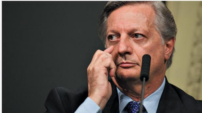
Imagen: Joaquín Salguero