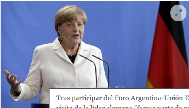
Merkel se reunirá el jueves

Tras participar del Foro Argentina-Unión Europea, Malcorra consideró que la visita de la líder alemana "forma parte de un diseño que tenemos desde el inicio de nuestra gestión de ir atando la integración a través de distintos mecanismos". Y agregó: "Todo esto es posicionar las prioridades, los objetivos y los intereses de la Argentina y del Mercosur en el mundo para maximizar las oportunidades en un momento en el que el mundo está cambiando".