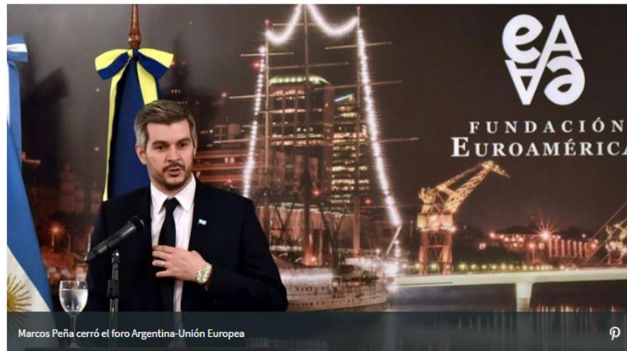
Marcos Peña cerró el foro Argentina-Unión Europea