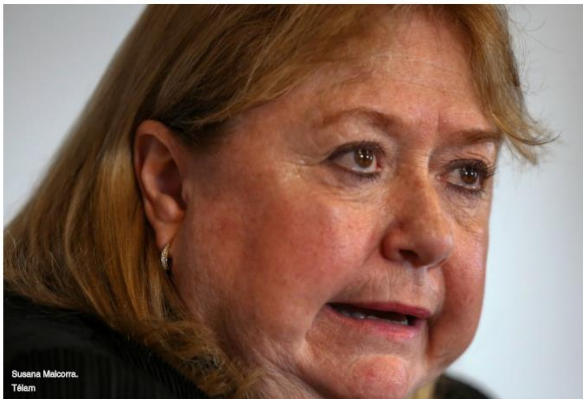
Susana Malcorra. Telam

Viernes 2 de Junio de 2017 Lo dijo la canciller argentina al disertar en el Foro Argentina-Unión Europea.