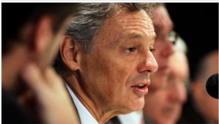
El ministro Cabrera disertó en el Foro Argentina-Unión Europea