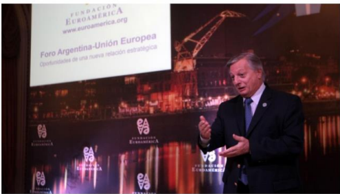
El ministro Aranguren, ayer en el foro Argentina-UE.