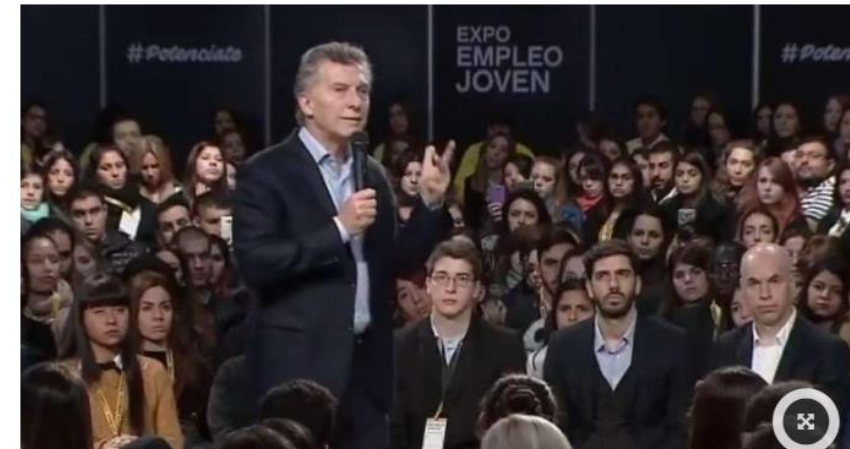
Mauricio Macri inauguró la Expo Empleo Joven, ciudad d

La confianza económica bajó 1.3 puntos. Lo político casi no se modifica.