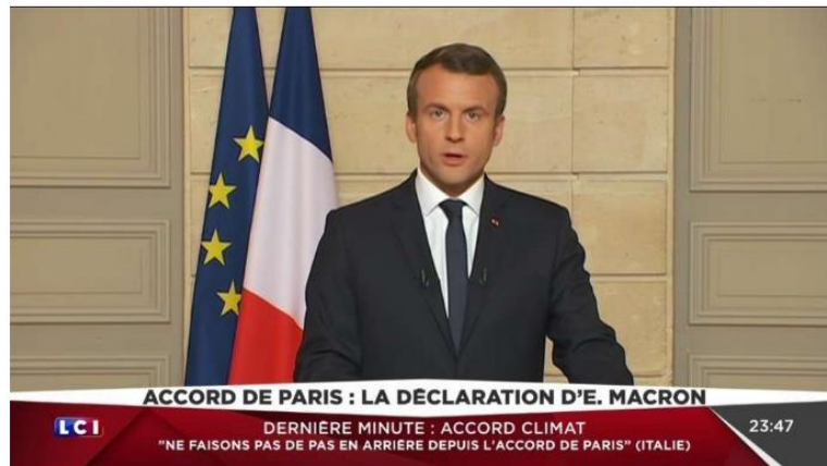
Emmanuel Macron, ayer.

Podría concretarse en el ámbito de la reunión del G20 en Hamburgo el 7 y el 8 de julio próximos.