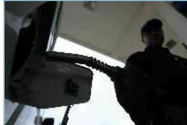
Los grifos de Lima cumplieron hoy la disposición de reducir el precio de sus combustibles en 1.2 por ciento en promedio, tal como anunciaron un día antes la Refinería La Pampilla (Relapasa), de Repsol YPF, y etroperu.

En ese sentido, sugirió al Poder Ejecutivo elaborar un plan adecuado de manejo y consumo de los recursos energéticos que tiene el Perú en