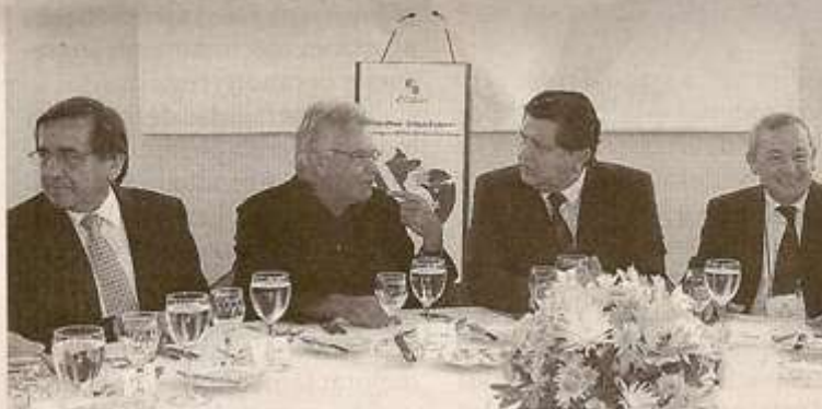
FORO. Jorge del Castillo, el ex jefe del Gobierno Español Felipe González, el presidente Alan García y el ex ministro español Carlos Solchaga.