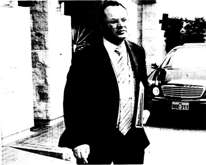
En el sector comunicaciones es donde se está produciendo un cambio tecnológico; mientras que sectores como la minería y la industria se encuentran un poco más rezagados, comentó el ministro Luis Carranza.

Cifra supera las expectativas de los agentes económicos, entre ellos el BCR, entidad que había previsto un flujo de US$ 3,800 m