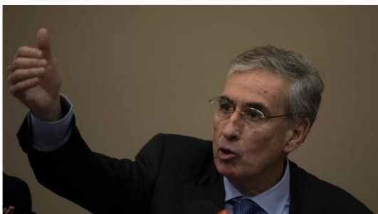
El Parlamento Europeo celebra 20 años de relaciones con América Latina con la vista en Venezuela

El Parlamento Europeo celebró hoy el veinte aniversario de las relaciones entre la Unión Europea (UE) y América Latina con el foco puesto en la incertidumbre en Venezuela y en las dificultades para cerrar un acuerdo comercial con los países del Mercado Común del Sur (Mercosur).