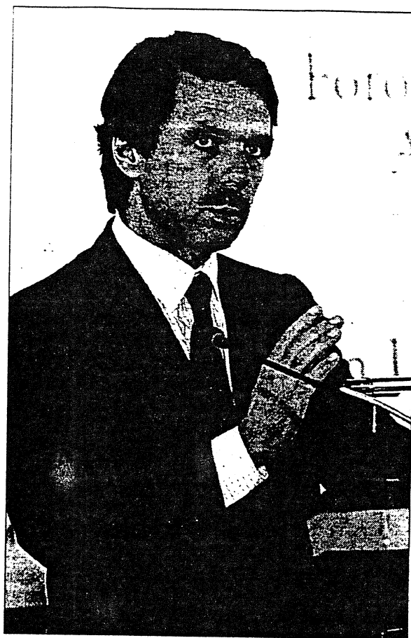
José María Aznar participó en el Foro de Fundaciones Europa, América Latina y Caribe.