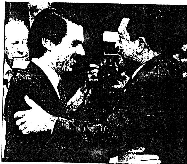
José María Aznar y Hugo Chávez se saludan efusivamente en La Moncloa.

satlántica. En este contexto, Aznar situó a España como "motor" del desarrollo de este área de libre comercio, inversión y respeto a los principios democráticos y de derecho, que "forman parte de nuestro propio ser constitucional". El presidente, que inauguró el I encuentro de Fundaciones de Europa, América Latina y Caribe, afirmó que los Quince se "volcarán estratégicamente" en esta zona con la que perfiló una "visión adecuada a este enfoque de reforzar los activos empresariales e intelectuales" en la cumbre de Río de Janeiro de 1999, la antecesora de la cita de Madrid. Aznar tampoco desaprovechó la ocasión de valorar positivamente la celebración de eventos de este tipo, entre