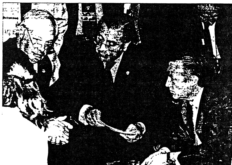
De izquierda a derecha, Chris Patten, Gustavo Fernández Saavedra y Josep Piqué.

El momento más importante de la cumbre será la firma