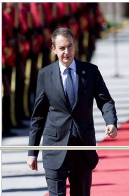
José Luis Rodríguez Zapatero, presidente de España, lidera también la Fundación Carolina, la cual apuesta por el valor de la educación.

dólares para otorgar becas de formación académica a niveles de posgrado y doctorado a jóvenes hombres y mujeres de la región, mencionó la ejecutiva.