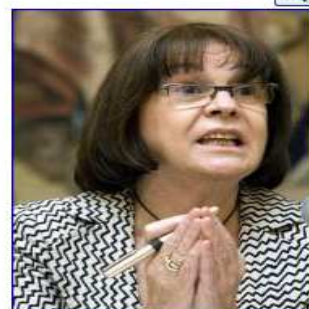
México acogerá foro sobre responsabilidad social de empresas ante la crisis