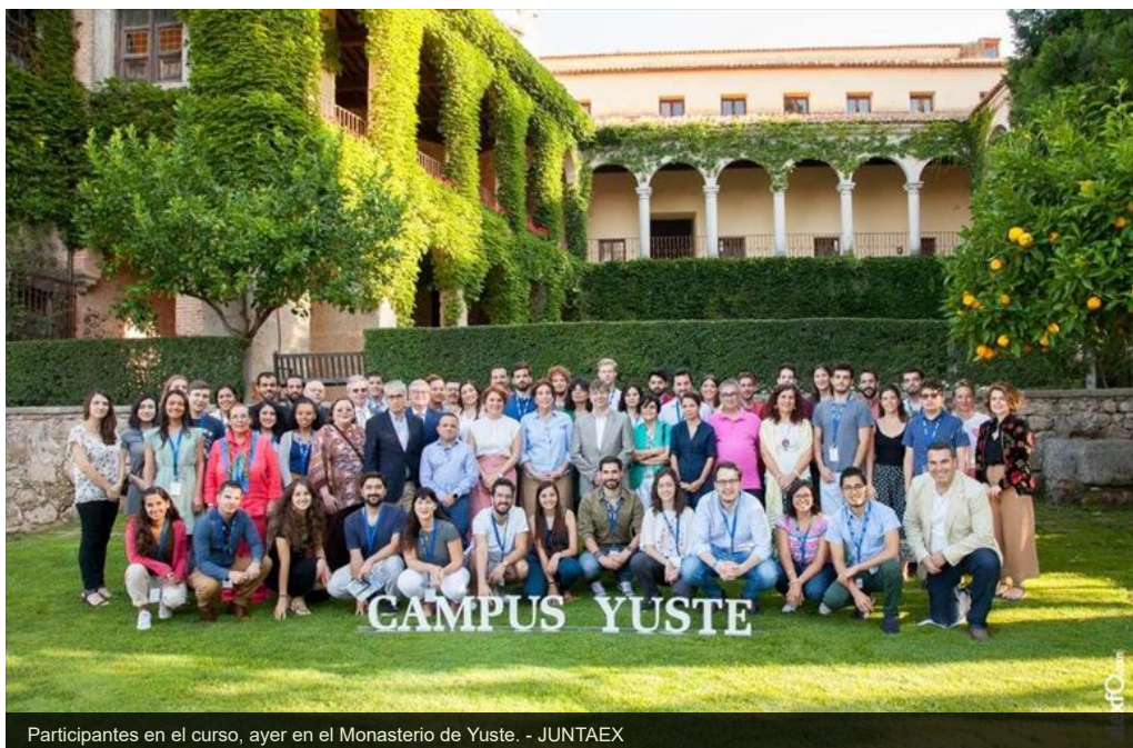
Participantes en el curso, ayer en el Monasterio de Yuste.