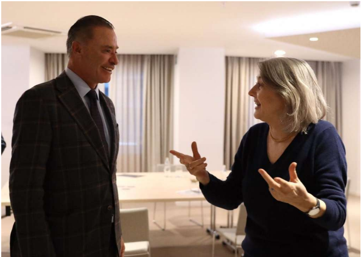
Primer día de la gira