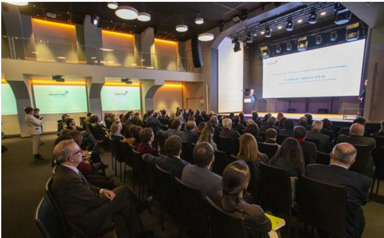
Por el escenario del centro de eventos Claridge, en el corazón de Bruselas, y ante unos 140 invitados, desfilaron los galardonados en esta cuarta edición de los premios Aquí Europa-Vocento.

Un mensaje en favor del periodismo serio, responsable y riguroso que reforzaría poco después Hildegard Stausberg, editora de Die Welt , a la que el jurado ha reconocido este año su labor profesional. «Europa tiene una posibilidad de futuro solo con periodismo serio», subrayó antes de apostar por «una alianza más intensa entre España, Europa y Latinoamérica» a la que también se sumaría Alemania.