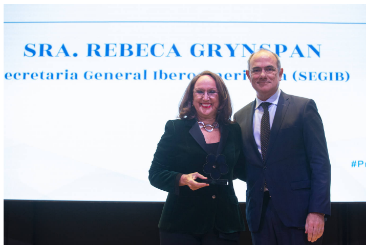
Rebeca Grynspan, Secretaria General Iberoamericana (SEGIB), recoge el Premio a la personalidad latinoamericana que más ha hecho por la construcción UE-América Latina, entregado por Jaume Duch, Portavoz del Parlamento Europeo y Director General de Comunicación.