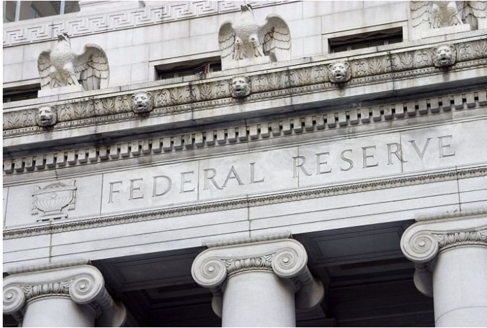
Reserva Federal.