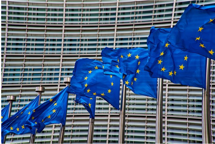
Banderas de Europa.