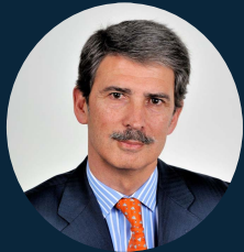
José Ignacio Salafranca