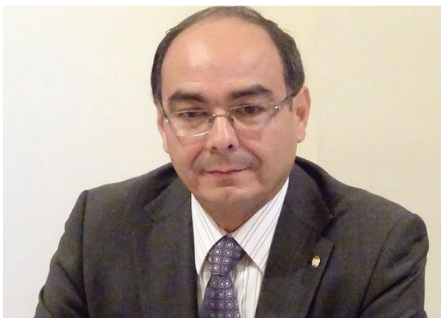
Antonio Rivas , Embajador de Paraguay

■ ■ Antonio Rivas , Embajador de la República del Paraguay en España