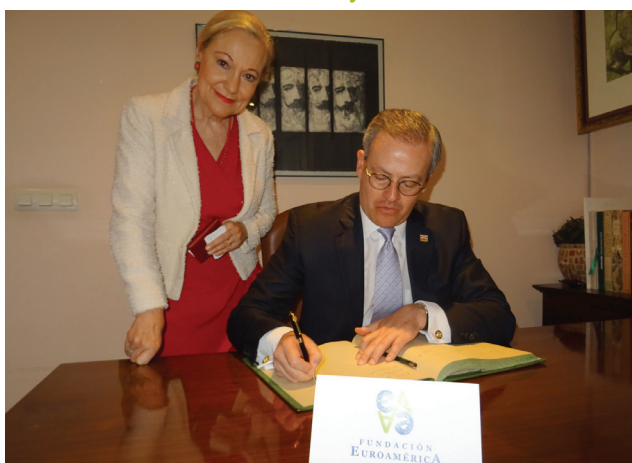
El ministro Manuel González Sanz firma en el libro de honor, en presencia de Benita Ferrero-Waldner

■ ■ Manuel González Sanz , Ministro de Relaciones Exteriores y Culto de Costa Rica