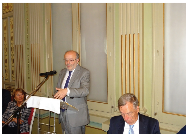
Intervención del invitado de honor