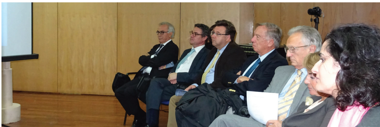
Asistentes al acto, en primera fila