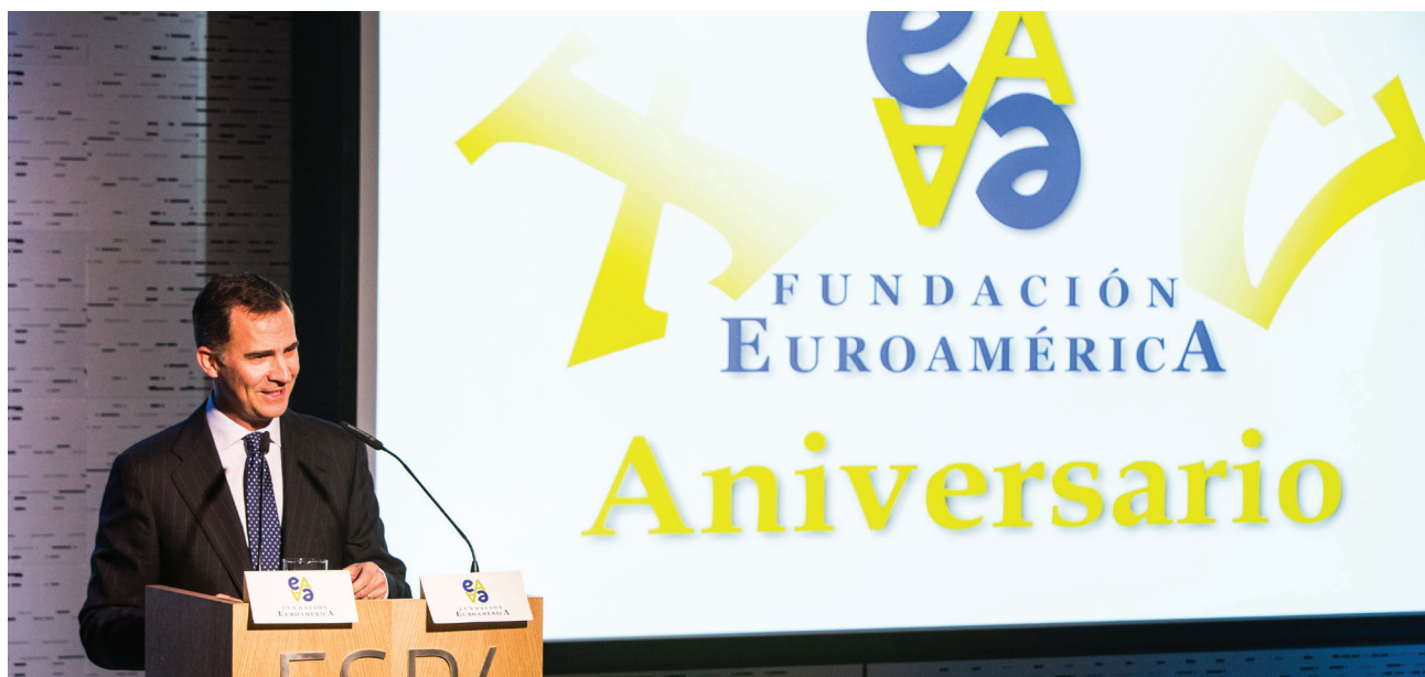
S.A.R. el Príncipe de Asturias, hoy S.M. el Rey Felipe VI, en la celebración del XV Aniversario de la Fundación Euroamérica

En esta línea de apoyo de la Casa Real, la Fundación se siente orgullosa de la presencia de S.A.R. el Príncipe de Asturias -ahora Su Majestad el Rey Felipe VI- en la celebración del XV aniversario de su constitución, en mayo de 2014.