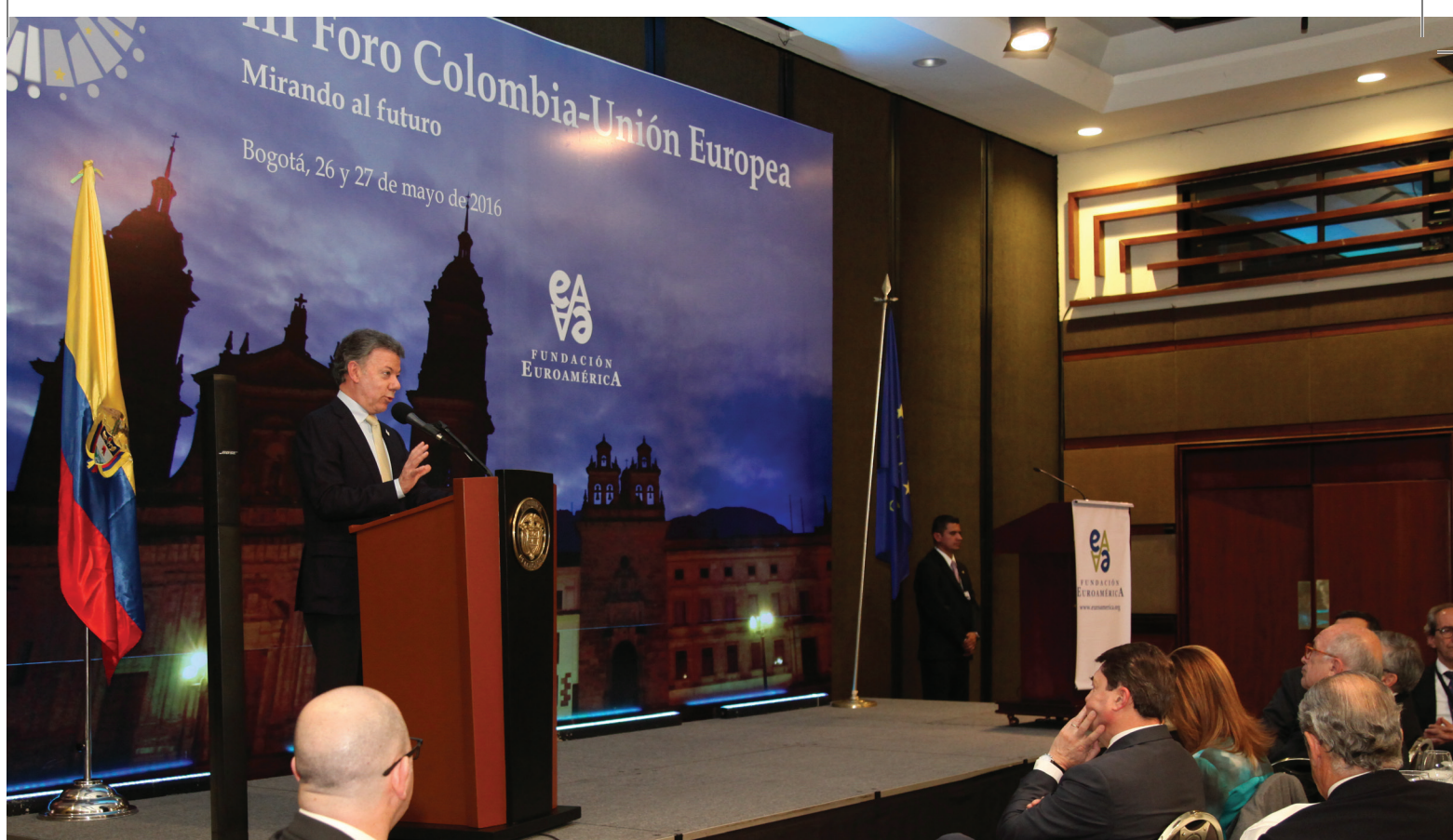
Intervención de Juan Manuel Santos , Presidente de la República de Colombia, en el almuerzo de clausura del Foro