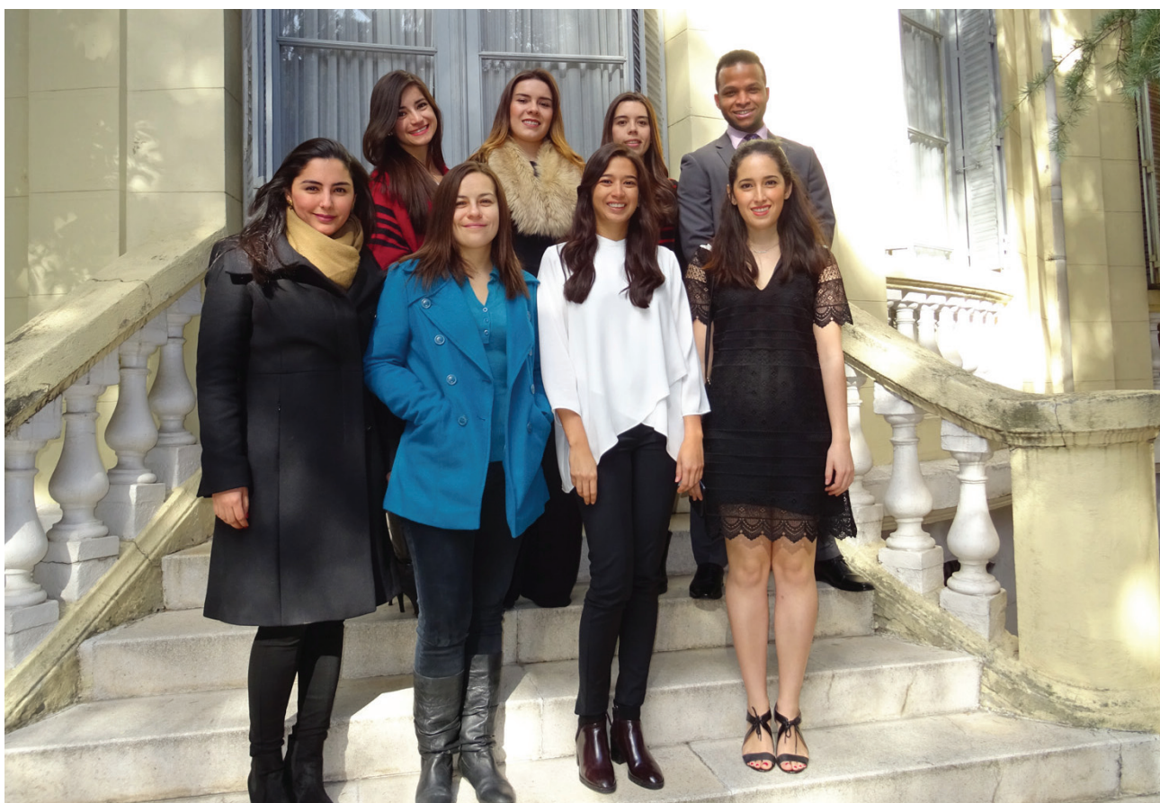
Becarios del Centro de Estudios Garrigues y de IE Business School

Los becarios del Centro de Estudios Garrigues y de IE Business School , del curso 2016-2017, visitaron la sede de la Fundación Euroamérica.