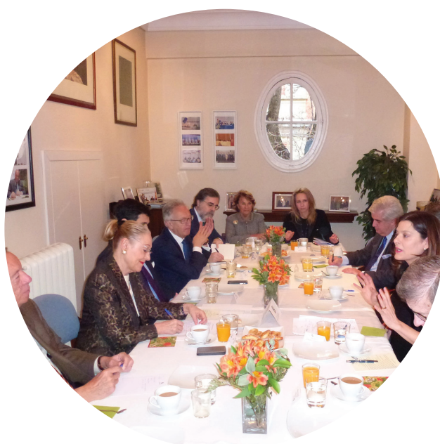
Formato de los desayunos-coloquio