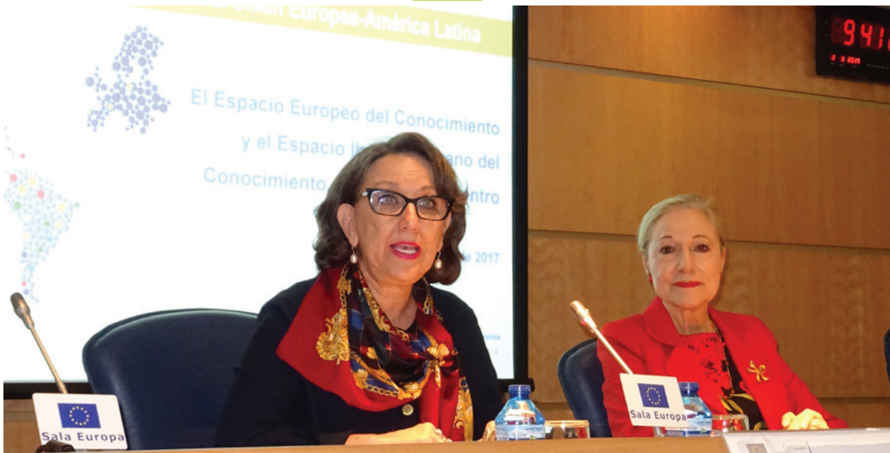
Rebeca Grynspan, Secretaria General Iberoamericana, y Benita Ferrero-Waldner, durante la inauguración