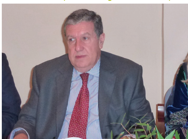
Embajador F. Ramón Puerta

■ ■ Federico Ramón Puerta , Embajador de la República Argentina en España