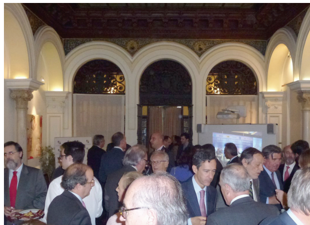
Asistentes al coctel previo al almuerzo-coloquio