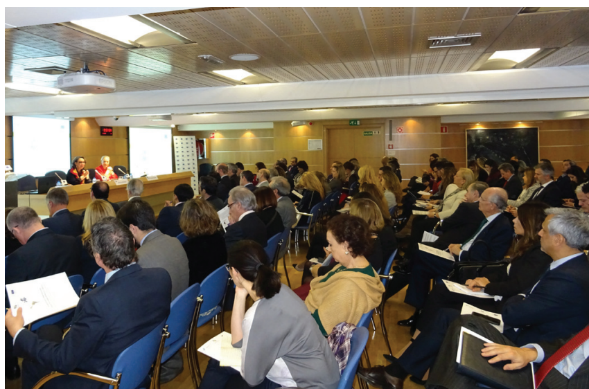
Vista de la sala