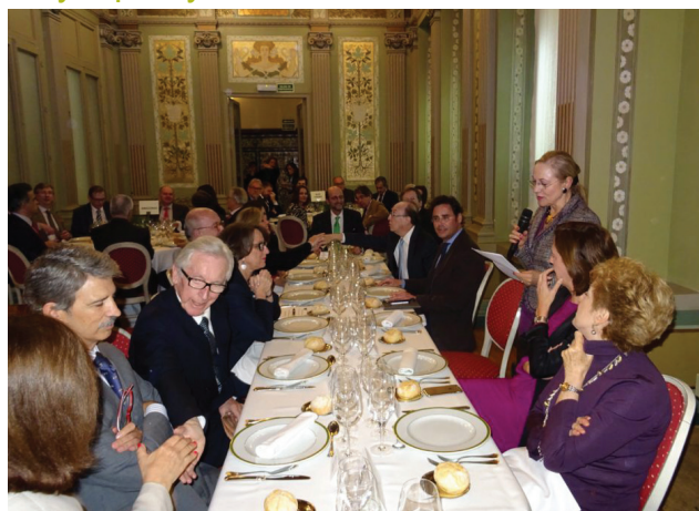
Mesa presidencial: Benita Ferrero-Waldner introduce el almuerzo-coloquio