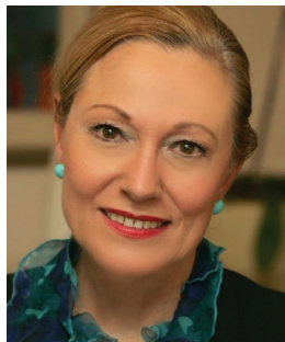
Benita Ferrero-Waldner Presidenta de la Fundación Euroamérica

En la Fundación Euroamérica hemos continuado trabajando, siempre con el doble objetivo de servir de instrumento real para el fortalecimiento de las relaciones entre Europa y América y a su vez con un enfoque de practicidad. Con este espíritu, celebramos el pasado año en Bogotá el III Foro Colombia-Unión Europea, que fue clausurado por el Presidente Juan Manuel Santos; el X Seminario Internacional Unión Europea-América Latina que en el 2017 trató sobre la cooperación entre los Espacios Europeo e Iberoamericano del Conocimiento; la presentación del Anuario del Cine Iberoamericano