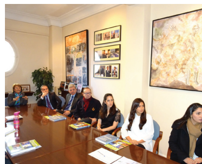
Reunión en la sede

Los alumnos recibieron variada documentación y alguna de las publicaciones editadas por la Fundación Euroamérica y hablaron de sus respectivos proyectos e ilusiones en el marco académico y profesional.