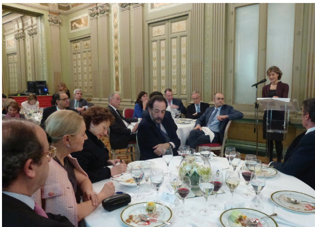
Isabel García Tejerina, Ministra de Agricultura, Alimentación y Medio Ambiente, interviene ante los asistentes al almuerzo-coloquio